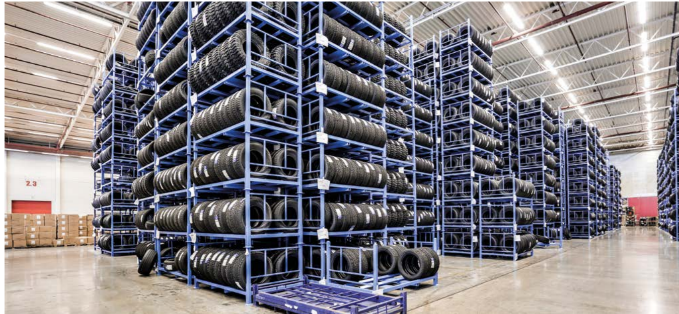
Reifen | 30.000 m 2 Reifenlogistik, von Hamburg in die ganze Welt