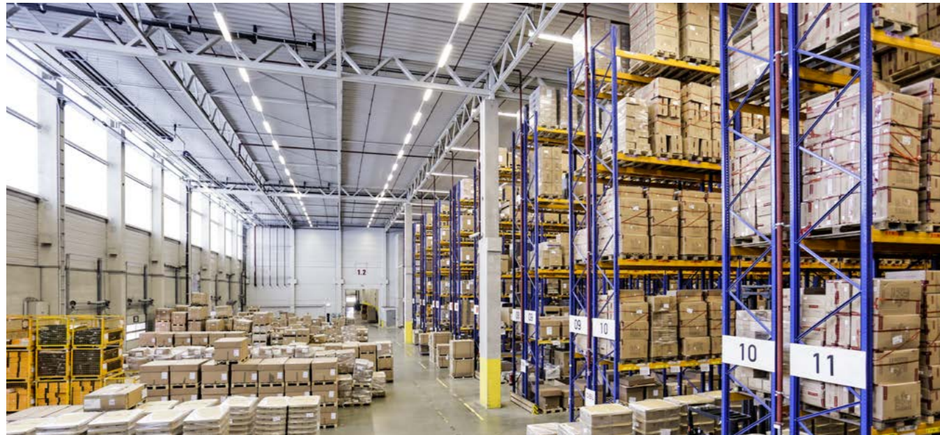
Palettenlager | 30.000 m 2 , flexibel und optimierte Regalfachhöhen